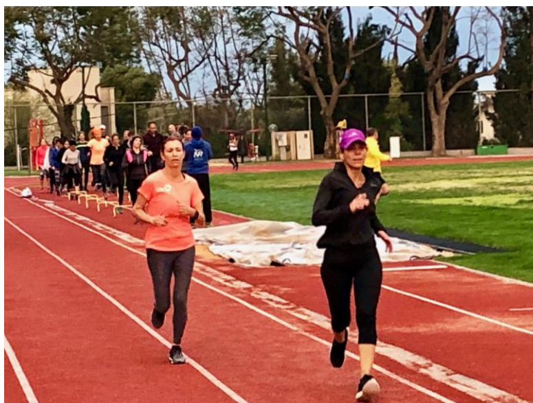
אחלה בוקר חברים