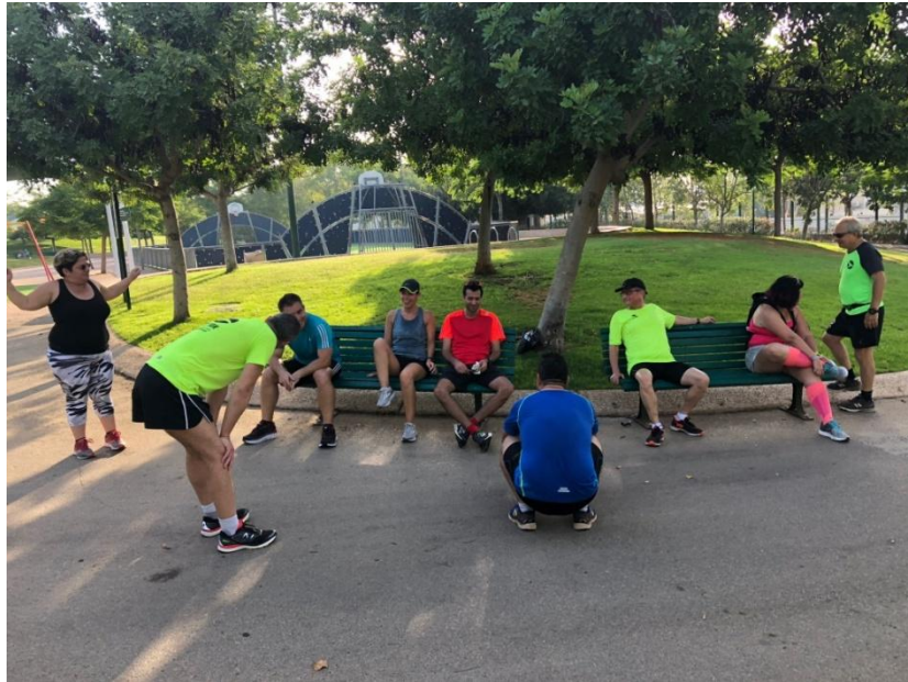
תודה משפחת קדוסי