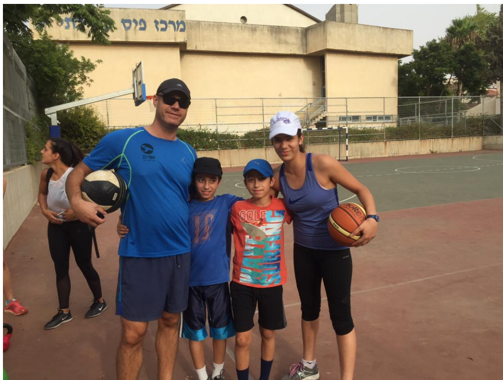
רק עברתי לומר שלום