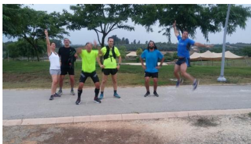
האימון ואז רואים שרואים טוב . . .